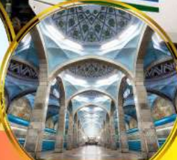
รถไฟฟ้าใต้ดิน