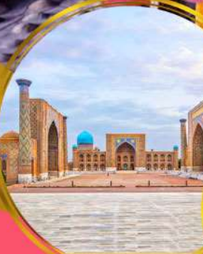
จัตุรัสเรฮิสถาน