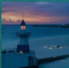
Light House Restaurant