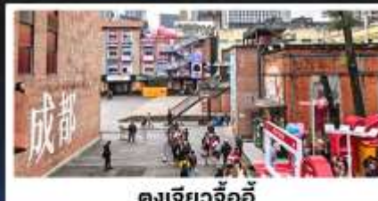
ตงเจียวจ้ออี้