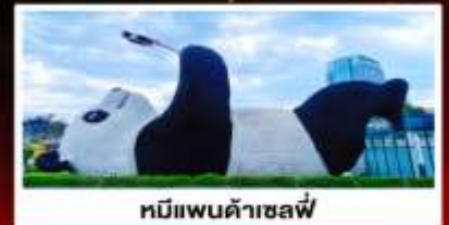
หมีแพนด้าเซลฟ์