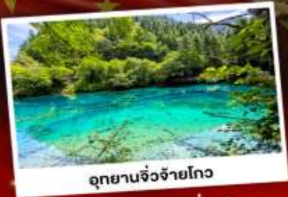
อุทยานจิ้งจายโกว