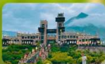
หมู่บ้านโบราณชนเผ่าเซียง