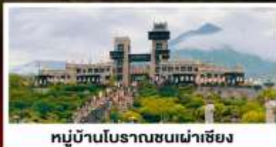
หมู่บ้านโบราณชนเผ่าเซียง