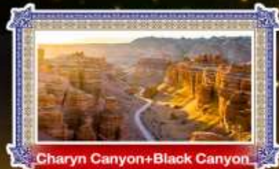
Charyn Canyon+Black Canyon