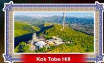
Kok Tobe Hill