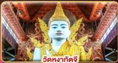
วัดหงาทัดจี