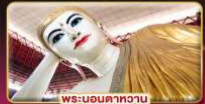
พระนอนคาทวน