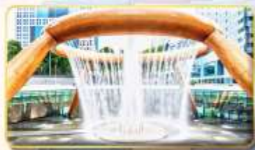
Fountain of Wealth