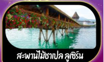
สะพานไม้ฆาปค ลูซิริน