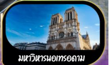
มหาวิหารนอทรอดาม