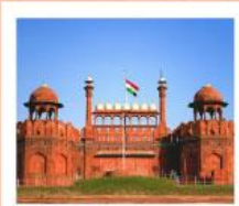
♥♥♥ Agra Fort