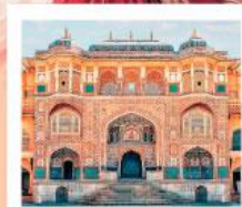
♥♥♥ Amber Fort