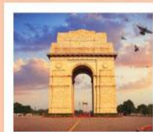
♥♥♥ India Gate