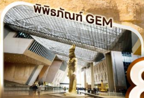
พิพิธภัณฑ์ GEM

พาน้ำศักดิ์แห่งอูเพตรา พาน้ำท่าแม่น้ำฟาโรห์