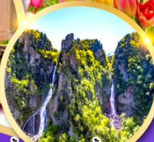
น้ำตกกิ่งกะ-น้ำตกริวเซ