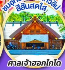
ชมอุทยานดอกทิวลิป สีแสนสดใส