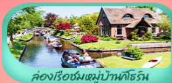
คลองเรือชมหมู่บ้านทอร์น