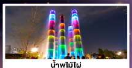
น้ำพุไม่ไผ่