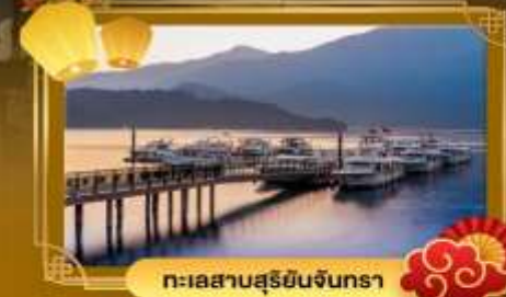
ทะเลสาบสุริยอินจันตรา