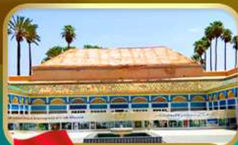
พระราชวังบาเอีย