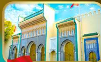
ประตูพระราชวังหลวง