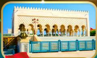
สุสานโมอัมเหม็ดที่ 5