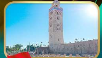
มัสยิดคูตูเบีย มาราเกช

หมู่บ้านเซฟซาอุน • หอคอยอัลซัน • ป้อมอูดายาส • สุเหร่าไครเวิน • สุสานมูเลย์ อีสมายิล • จัตุรัสจามาเอลฟา • อัฒจันทร์ • ป้อมทาจูริก • ย่านฮูบัส • จัตุรัสโมอัมเหม็ดที่ 5