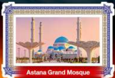
Astana Grand Mosque