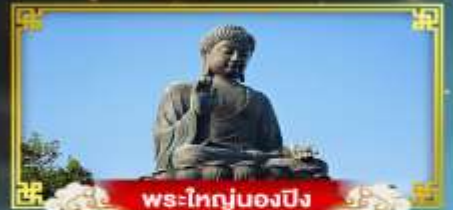
พระใหญ่ของปิง