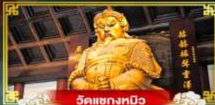
วัดเขangkมพู