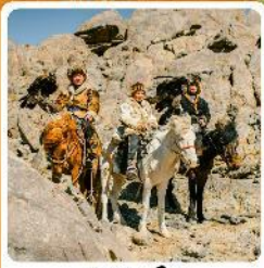
ชาวมองโกล