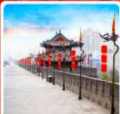
กำแพงเมืองโบราณซีอาน