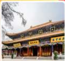
วัดต้าซิงซาน

• โลกที่เกี่ยวขมรดกโลก สุสานกองทัพทหารจีนซีอานจะได้ ถ่ายภาพความยิ่งใหญ่ของเจดีย์ห้าชั้นปาใหญ่