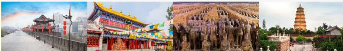
กำแพงเมืองโบราณ