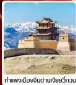
กำแพงเมืองจีนด่านเสี่ยววีกวน

• ไซโล่...เส้นทางสายไหม ชมสระบัววังพระจันทร์ ทะเลทรายหมีงาช้าง กำแพงเมืองจีนด่านสุดท้าย "เจียยวีกวน" มรดกโลกภูเขาสายรุ้งจางเย่