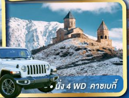
• นั่ง 4 WD คาซเบก