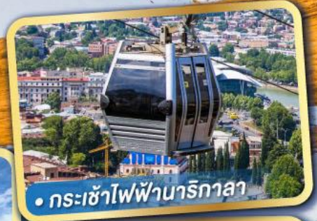
• กระเช้าไฟฟ้านาริกาลา