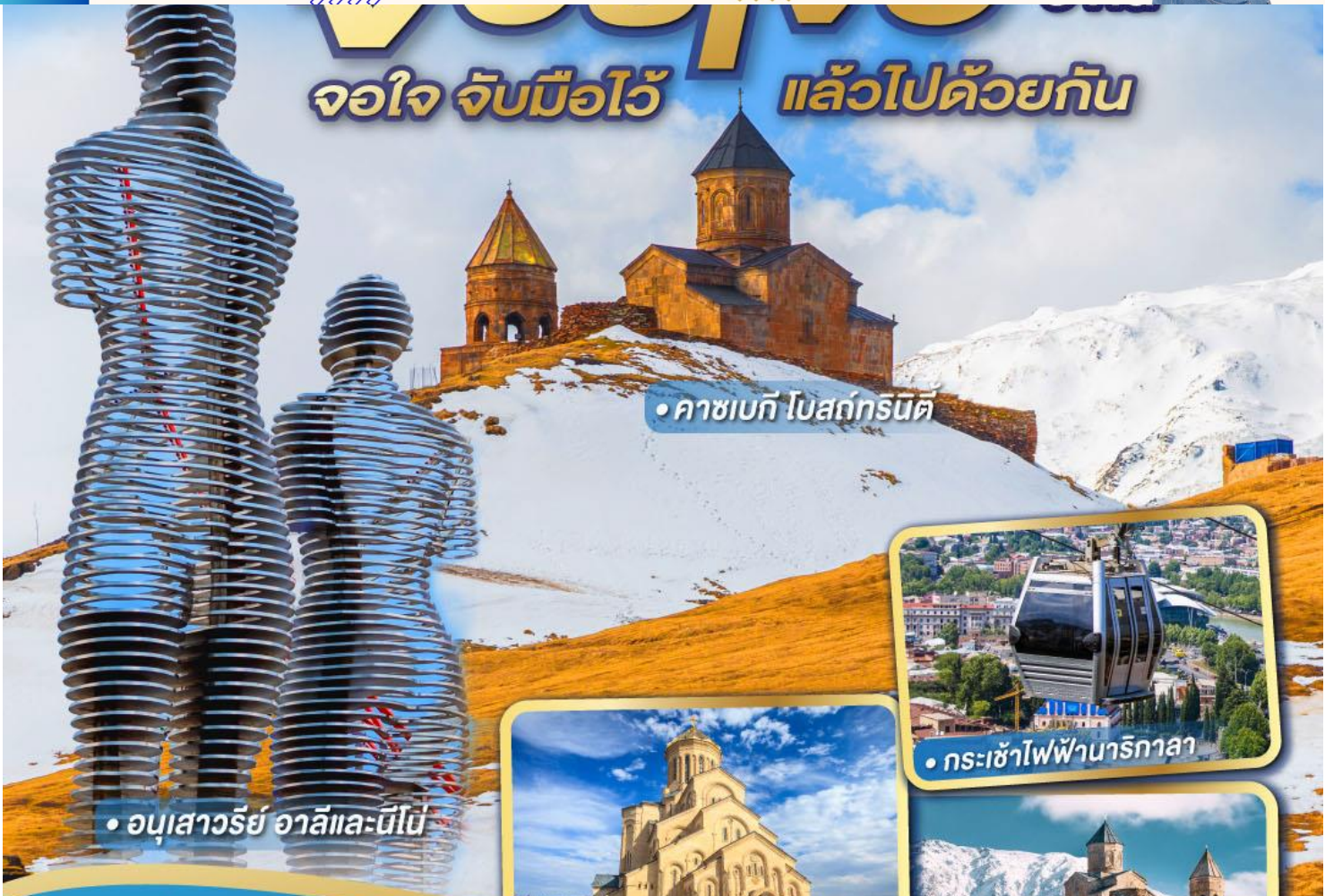
• คาซเบก โปสถ์กรนิต