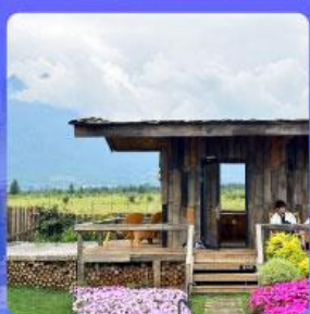
ร้านกาแฟหยุนตัน