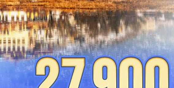
เริ่มต้น