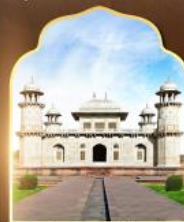
ถ้ำมาชาน้อย