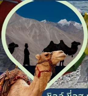
ซิลลี่ ซ็อซู่ ทะเลทราย กลางอ้อมกอดหิมาลัย