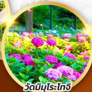
วัดมิมุโระโทจิ