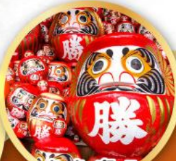
วัดคัตสึโฮจิ (วัดदारุมะ)

ชมความงามของกำแพงหิมะ เส้นทางสายอัลไพน์ทาเคยาม่า (JAPAN ALPS SNOW WALL)