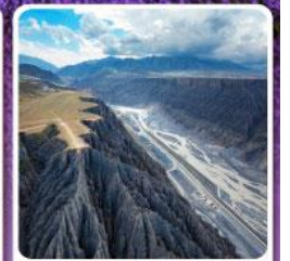
แกรนด์แคนยอนคู่ซานจื่อ