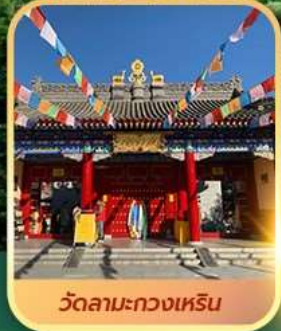
วัดลามะทวงเหริน