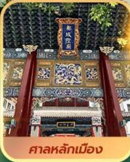
ศาลหลักเมือง