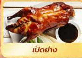
เป็ดย่าง