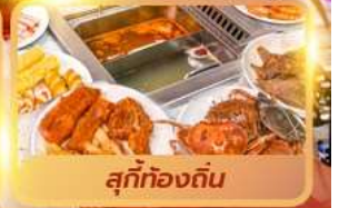
สุกี้ท้องถิ่น