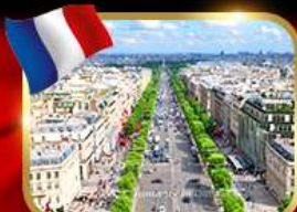
เดินเล่นย่านช็องเซลีซ