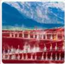
Impressions of Lijiang