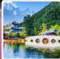
สะพานมังกรดำ