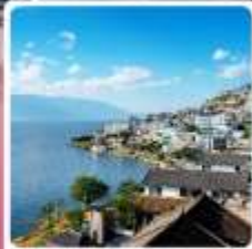
วัดต๋องตัว S ทะเลสาบเอ๋อร์ไห่