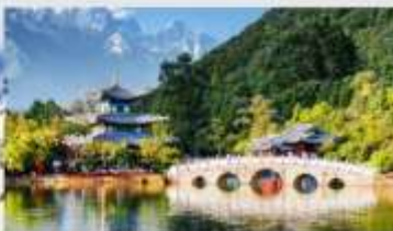
สระมิงกรต้า

*ทางบริษัทฯ ขอสงวนสิทธิ์ในการสลับโปรแกรมทัวร์ตามความเหมาะสมขึ้นอยู่กับสถานการณ์หน้างาน โดยคำนึงถึงผลประโยชน์ของลูกค้าเป็นสำคัญ