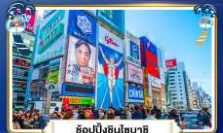
ช้อปปิ้งชินโซบาสึ