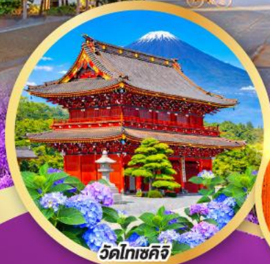
วัดโทเซคิจิ