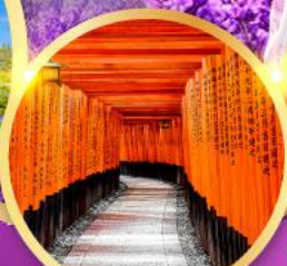
ศาลเจ้าฟุชิมิอินาริ