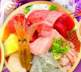
ตลาดปลาฮิมสุ คาชิโนะอิชิ