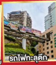
รถไฟทะเลตึก