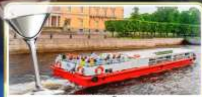
ล่องเรือแม่น้ำเนวา พร้อมเสิร์ฟ Vodka Tasting

เดินทาง : 14-21 มิ.ย.69 / 28 มิ.ย.-05 ก.ค.69 / 24-31 ก.ค.69