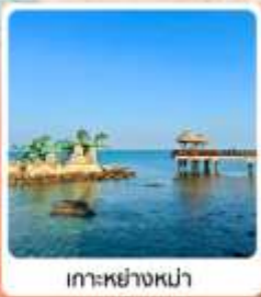
เกาะหย่างหม่า