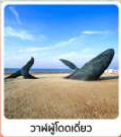
วาฬผู้โดดเดี่ยว

เดินทาง มีนาคม - มิถุนายน 2569 ราคาเริ่มต้น 17,888