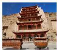
ถ้ำม่อเกาคุ