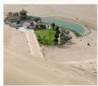
เป็นทรายหมิงซาซาน