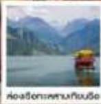
เบ่ไห่ชานฉีชาน