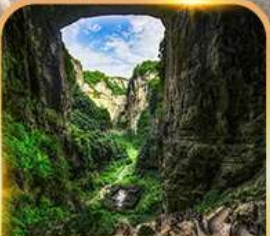
อุทยานหลุมฟ้า 3 สะพานสวรรค์