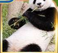
สวนสัตว์จงชิ่ง