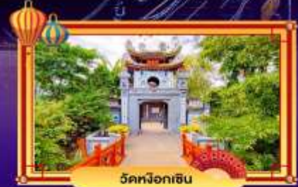
วัดผ้อกฮิน