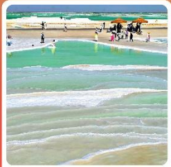
ทะเลสาบเกลือจาเอ้อหาน