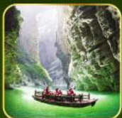
ล่องเรือแม่น้ำไตคินกุฮิว