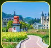
สวน Alice's Garden