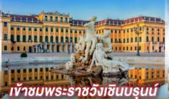
เข้าชมพระราชวังฮินบรุนน์