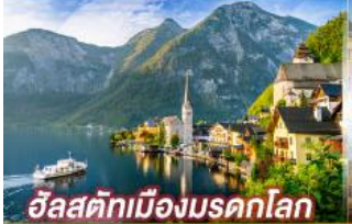
อิลสติกเมืองมรดกโลก