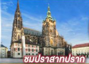
ชมปราสาทปราก