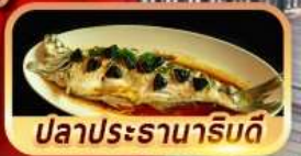
ปลาประรานาภิรมดี