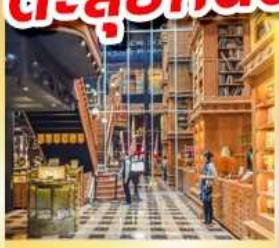
ร้านไอศกรีมมียาฮาร์