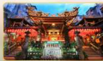
วัดเทียนฮั้ว จอพระเจ้าแม่หม่าจู้