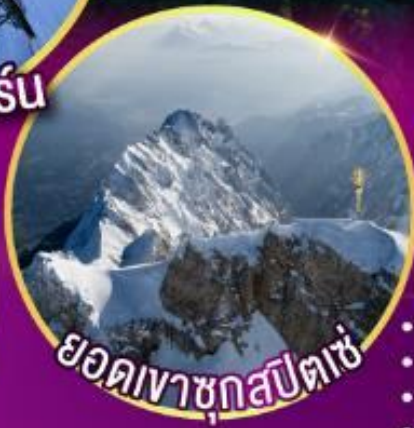
ยอดเขาชุกสปีตซ์