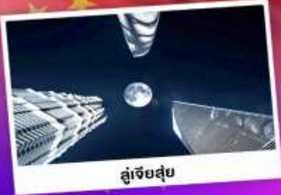
ดูเจ็ทสูย