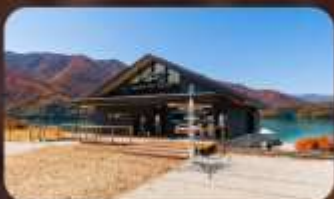
AO Lakeside Cafe'