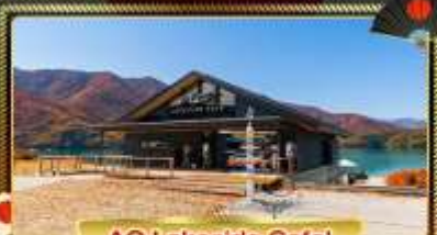
AO Lakeside Cafe'