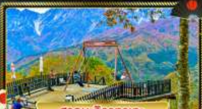
อากาศ: อิวากาตะ