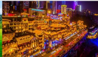
หงหยาดิง