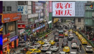
กวนอิมเจียว

*ทางบริษัทฯ ขอสงวนสิทธิ์ในการสลับโปรแกรมทัวร์ตามความเหมาะสมขึ้นอยู่กับสถานการณ์หน้างาน โดยคำนึงถึงผลประโยชน์ของลูกค้าเป็นสำคัญ