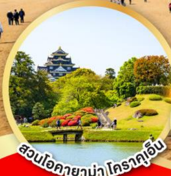
สวนโอคายาม่า โคราคูเอ็น