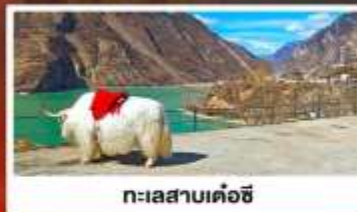
ทะเลสาบเค่อซี