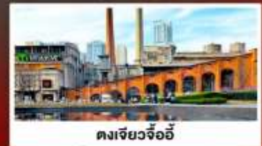
ตงเจียวจ้ออ๊