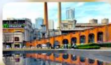
ตงเจียวจื่ออี้