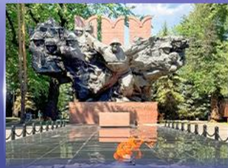
สวนสาธารณะ 28 Panfilov Park