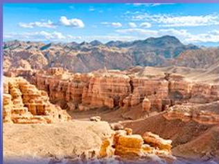
หุบเขาซาริน แคนยอน