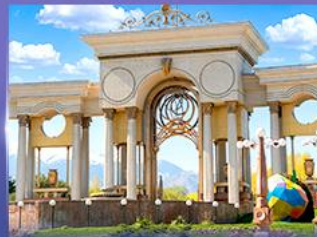
สวนสาธารณะประธาธิบดี