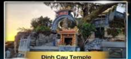
Dinh Cau Temple